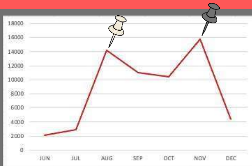
Az ÖCSI Instagram oldal elérései - 2023